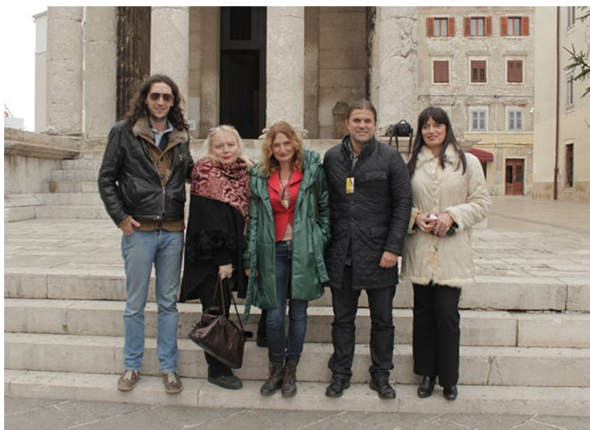
članice i članovi Umetničkog pres karavana

Umetnički pres karavan je drugu godinu zaredom ispratio pulski Sajem knjiga u Istri održan u periodu od 3. do 13. decembra.