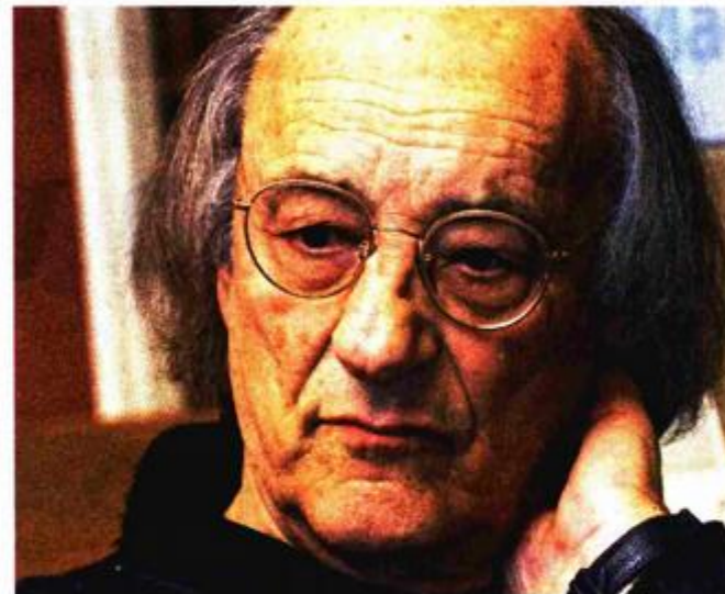
Mirko Kovač dobitnik je Kiklopa za životno djelo