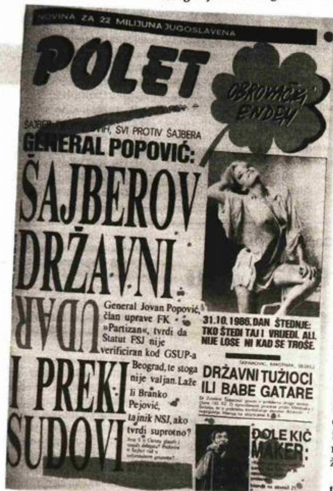
Jedna od naslovnica poleta iz 1986.