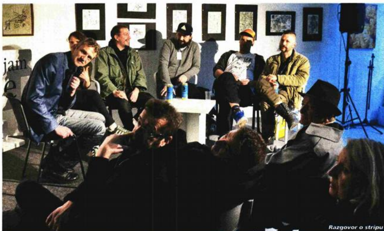
Razgovor o stripu

"Kililana Song" objavila je nakladnička kuća Fibra, a radi se o knjizi u stripu koji je Šagadin opisao kao "jedno od najljepših putovanja na koje se može poći", s pričom smještenom u Keniju, a Flaoo je predstavio kao jednog od najboljih francuskih stripaša. U Keniju je Flaoo došao prije deset godina i zaljubio se u malo otočko mjesto. "Prije nego sam izradio strip, radio sam skice. Pokušavam uroniti u mjesto tako