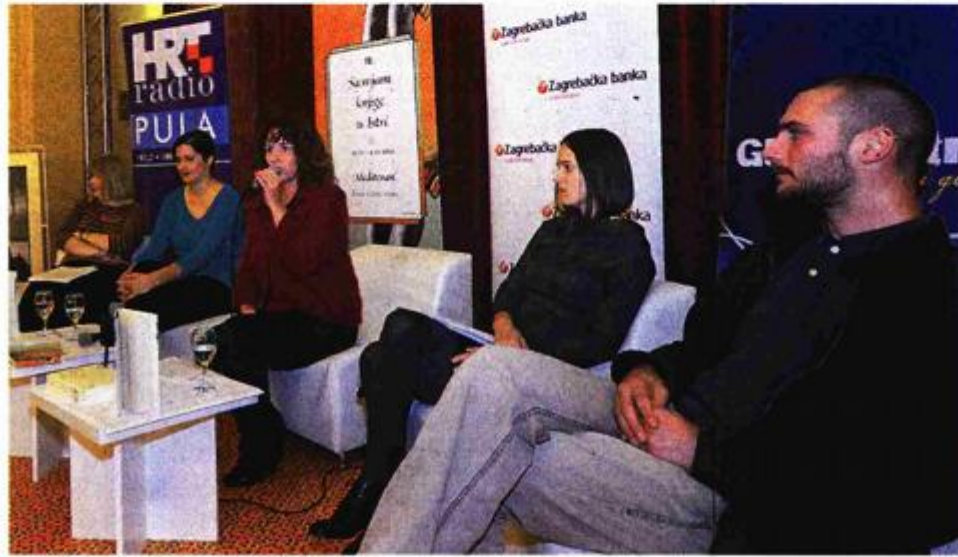
Obilježje programa i gostiju – s konferencije za novinare

– Galerija »Cvajner« će ugostiti nekoliko programa, a svaku večer tamo će se održavati vinil večeri s izborom ploča naših autora. U Rock Caffeu će se održavati koncerti, dok će u kafiću P14 biti održan rodendanski party sajma. U galeriji »Makina« pulski fotografi će napraviti izložbu u čast Draganu Veli-