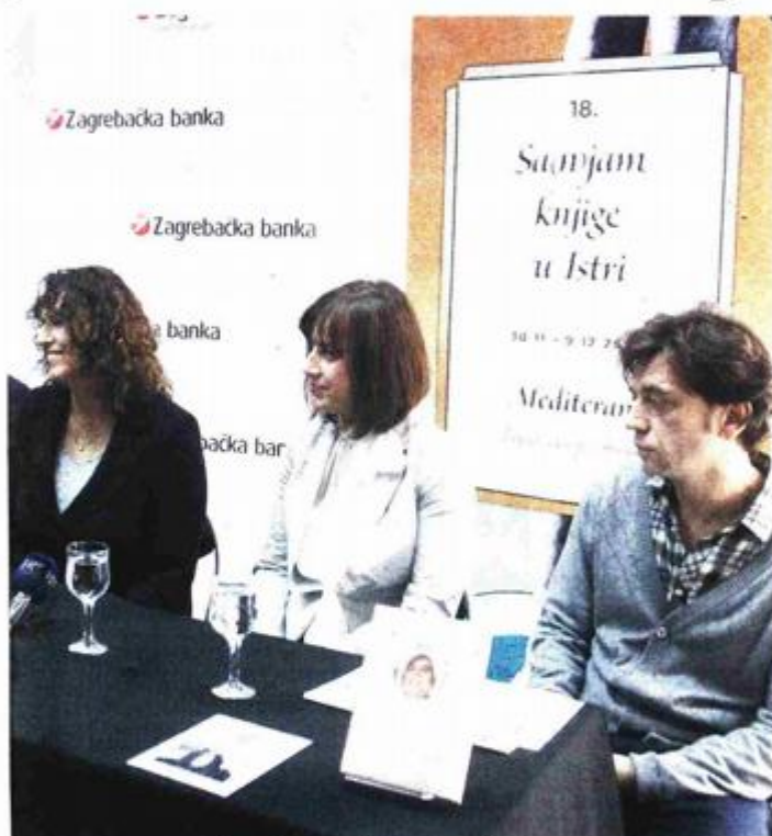
5 konferencije 18. sajma knjige u Istri u Castropoli