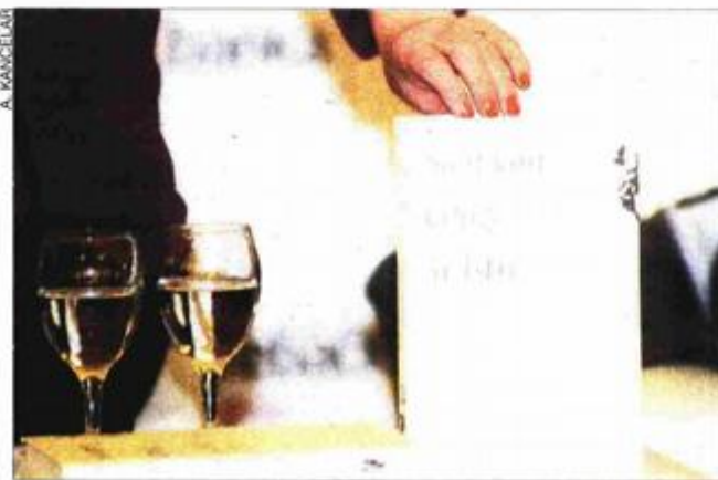
Katalog ovogodišnjeg sajma