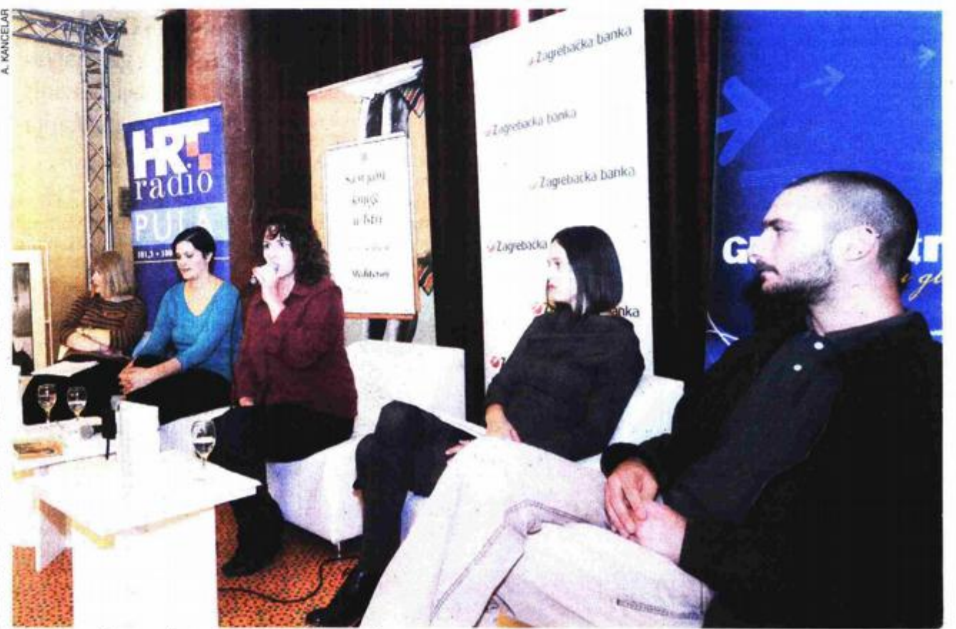
S konferencije za novinare 18. sajma knjige u Istri

Ove ćemo ove godine, uz tradicionalnu suradnju sa studentima pulskog sveučilišta, prvi puta imati prodavače i informatore volontere koji dolaze s Odsjeka za informacijske znanosti sveučilišta u Zadru te s Turkolgije Sveučilišta u Zagrebu. Sajam se otvara u petak u 18 sati, a svojim kupcima i posjetiteljima omogućiti će kasnovečernji šoping do 23 sata. Sajam će osim prvog dana biti otvoren od 9 do 21 sat, kazala je Toić. Vodopija je istaknula da je ove godine otvorenje sajma pomaknuto u večernji termin te da režiju ponovo potpisuje Mauricio Ferlin.