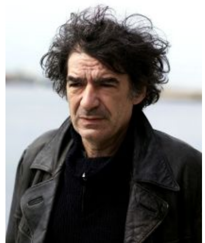
Predrag Miki Manojlović

Program Beograd čita u jednom je dijelu i posveta filmskoj Puli, jer nam zlatnim Arenama nagrađivani, miljenici pulske